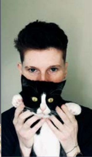
Su mylima katyte.