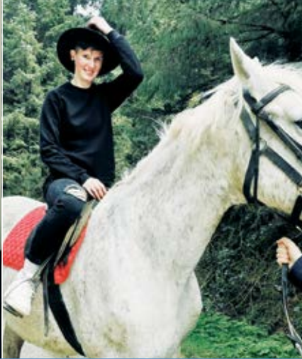
Herojė – ne naujokė ir ant žirgo.