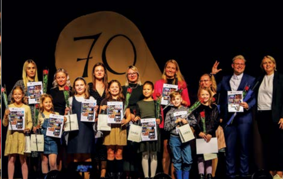
Jungtinis vaikų ir jaunimo imituojamųjų dainų kolektyvas.