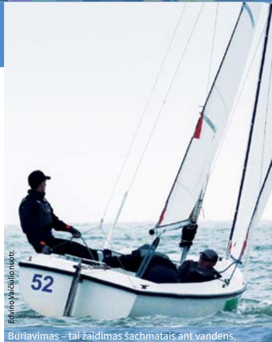
Buriavimas – tai žaidimas šachmatais ant vandens.

Supratusi, kad reikia su buriavimu supa-