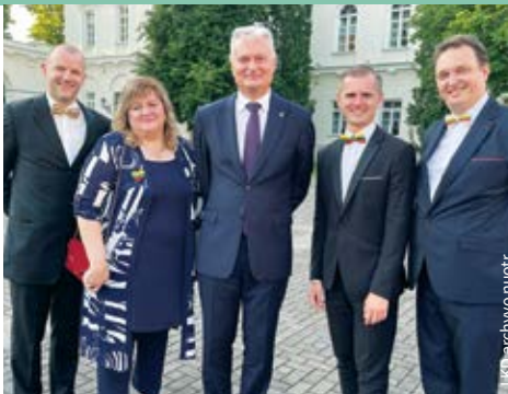
Valstybės dieną Prezidentūros kiemelyje, 2021 m.

Manau, jei mokytis pedagogas nenori, visada ras priežasčių, kodėl to nedaryti. Vis