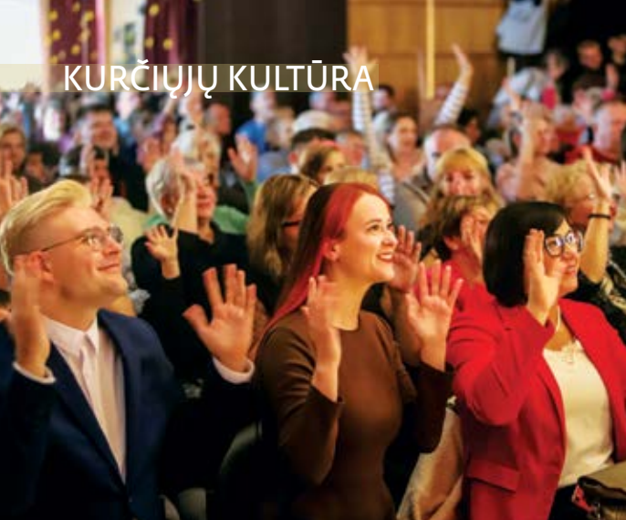
Jubiliejinio renginio dalyviai ir svečiai.