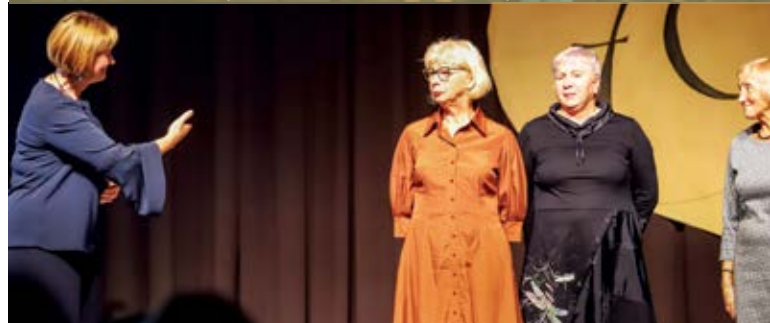
Padėkos gestas pantomimos būrelio aktoriams.