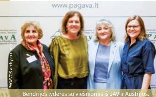
Bendrijos lyderės su viešniomis iš JAV ir Austrijos.