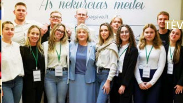
Pirmininkė su konferencijos savanoriais – PAGAVOS jaunimu.