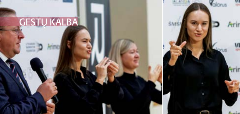
Gestų kalbos vertėja mėgsta iššūkius: imasi ir sudėtingų vertimų.